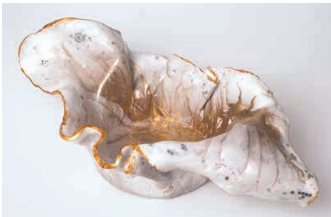
«Вазочка», выполнена из эпоксидной смолы, 2020

«Космос», металлический поднос, эпоксидная смола, диаметр 50, 2020