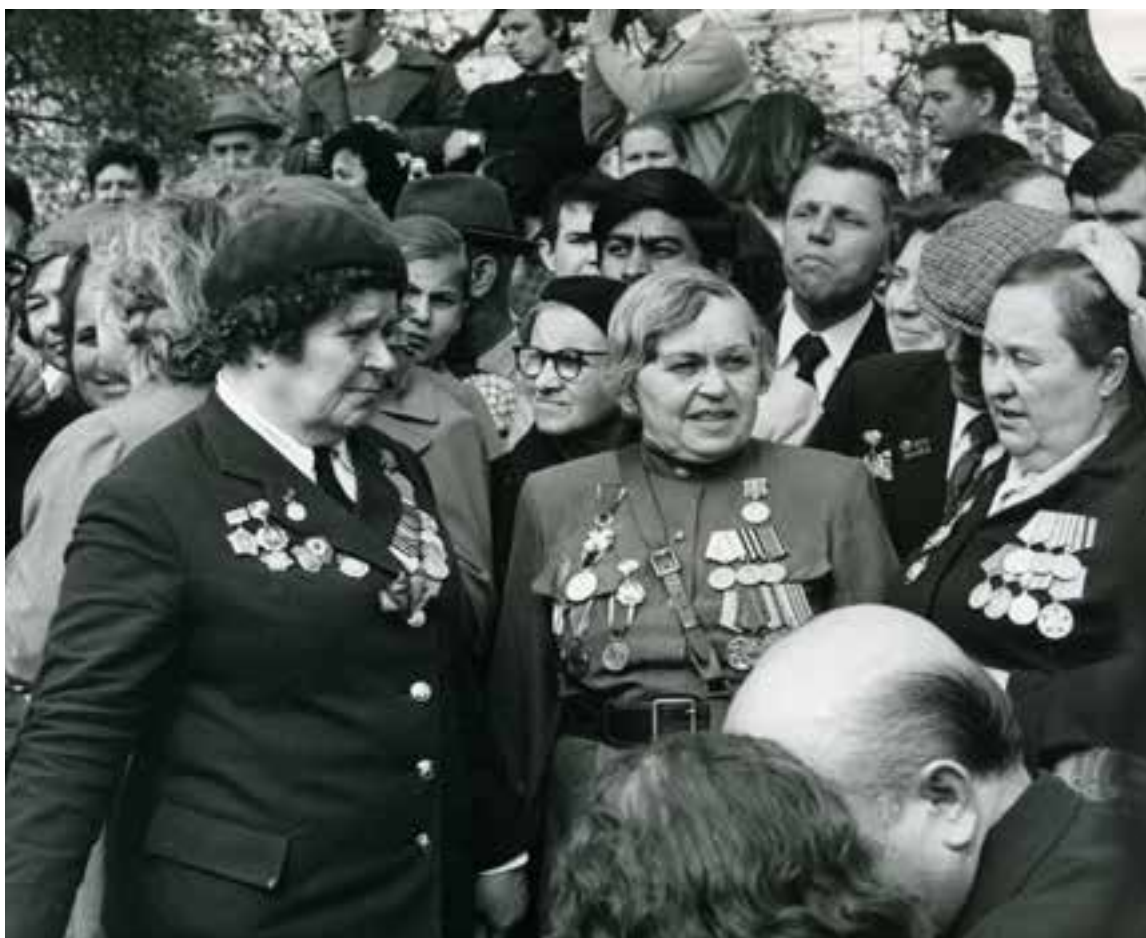
Из цикла «Через всё прошли и победили!». 1981 год