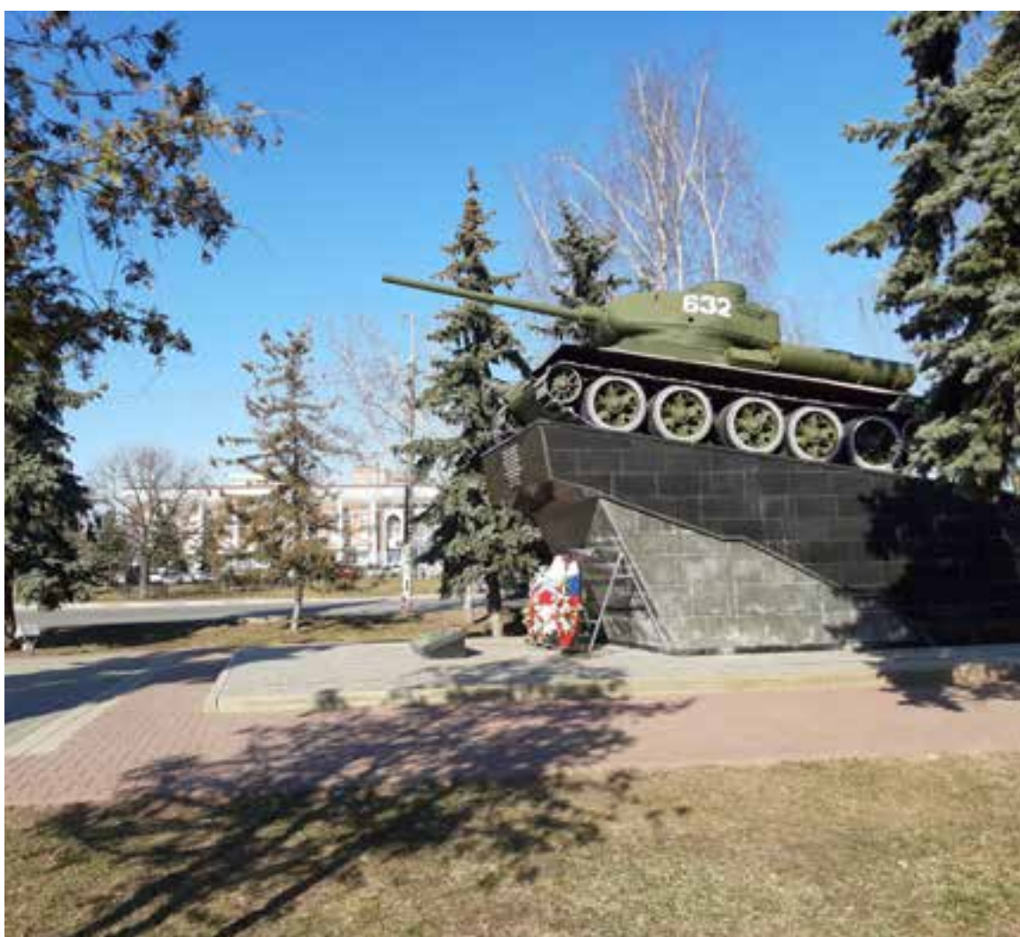
«Мемориальный комплекс», фотографии 2020 года, г. Чехов, Московская область